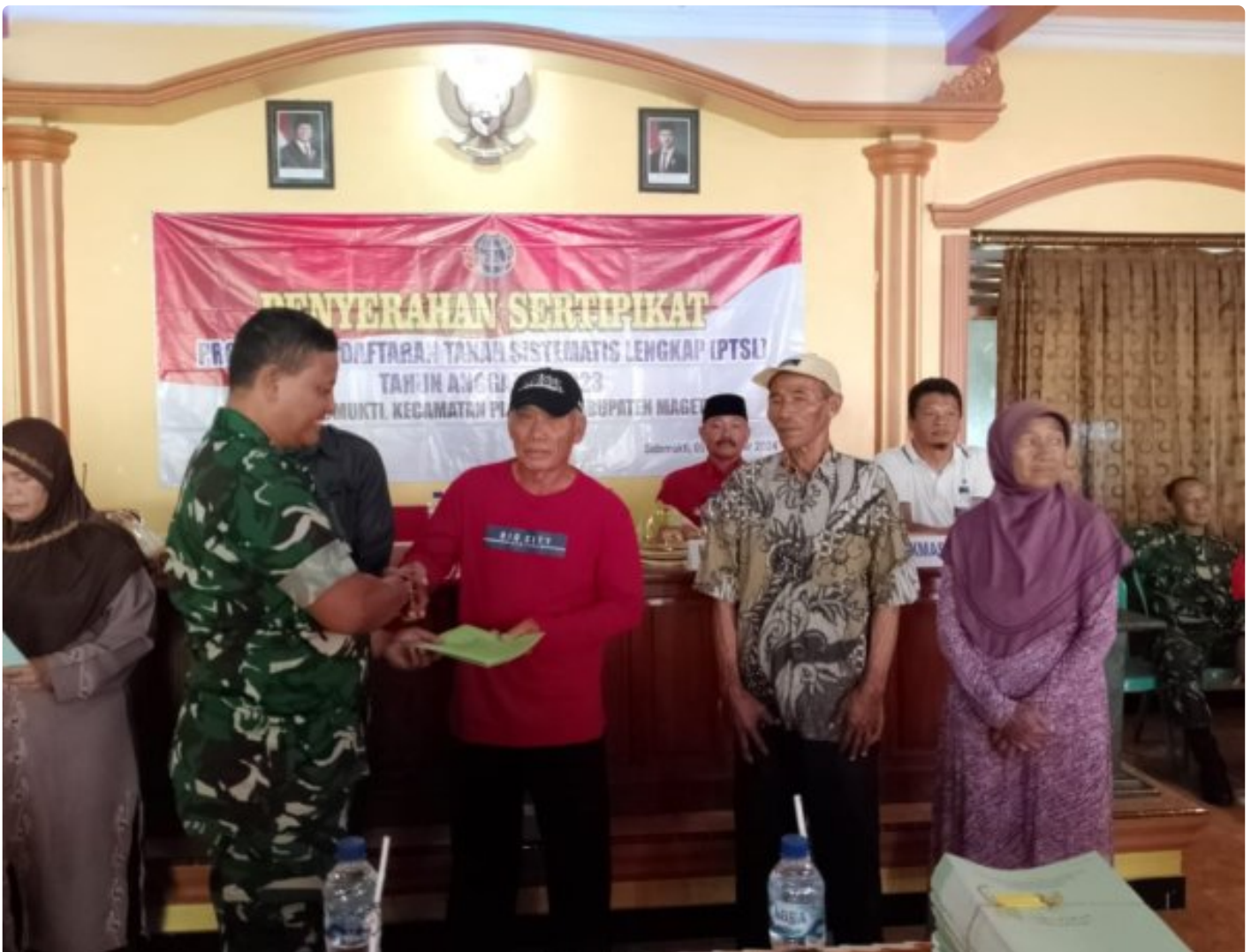
Danramil 0804/02 Plaosan Hadiri Penyerahan Sertifikat Program Pendaftaran Tanah Sistematis Lengkap (PTSL) Desa Sidomukti

PLAOSAN. - Desa Sidomukti melalui Badan Pertanahan Nasional (BPN) melakukan penyerahan Sertifikat Tanah Program Pendaftaran Tanah Sistematis