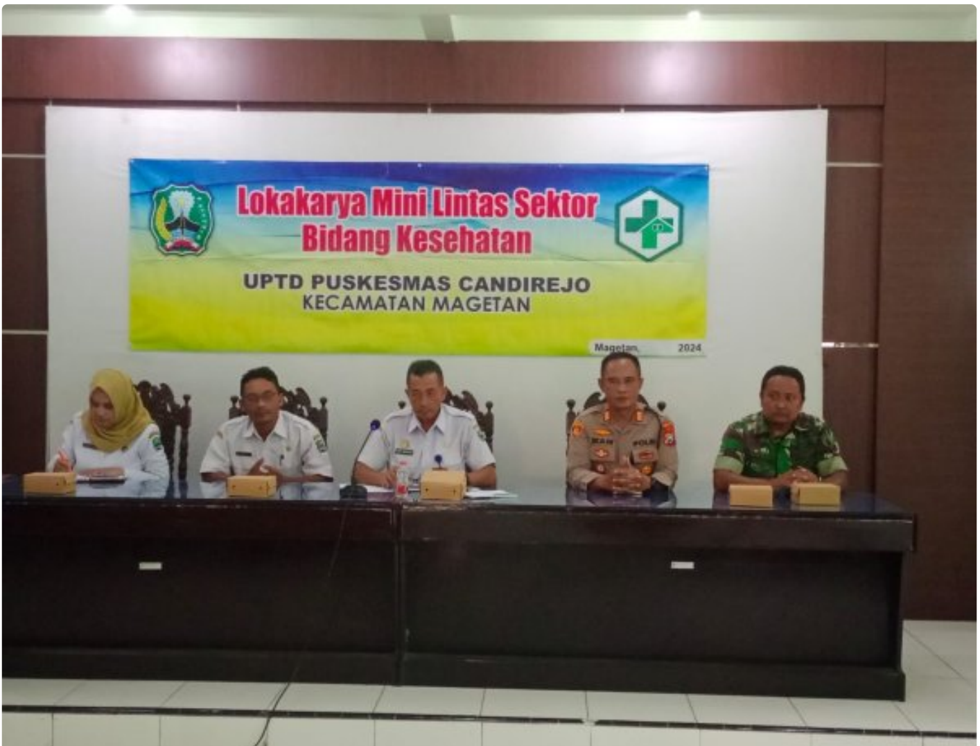
Bati TUUD Koramil 0804/01 Magetan Hadiri Loka Karya Mini Lintas Sektor Tri Bulanan Bidang Kesehatan